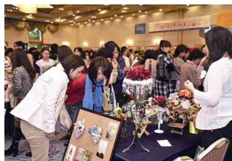
昨年の北摂会場の様子

手作り作品の販売・展示と、リビング新聞の読者とのふれあいを目的に企画された催しに足を運んでみませんか。北摂ではすでに2回開催され、大人気のイベントですが、今年は、堺に続き、宝塚でも初めて開催されます。ジャンルなどを考慮して、厳正な抽選で選ばれた50組の読者による手作り作品のブースが勢ぞろい。見るだけでも楽しい、アートのおまつりに、ぜひお越しください。当日は、企業協賛ブースや楽しいブースも開催される予定です。